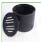
Eindkap - 80 mm - Schroefdop