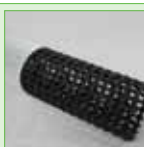
AirMax 45 beluchttingsbuis - 80 mm - met kous