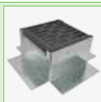
Eindkap - 170 x 170 mm - Verzinkt gesherardiseerd.