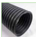
Bewateringsbuis - 160 mm