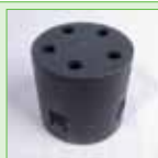
Eindkap - 80 mm - Klikeindkap