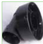
T-stuk - 80 x 80 x 160 mm