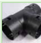
T-stuk - 80 x 80 x 80 mm