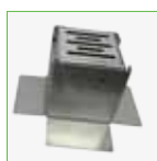
Eindkap - 100 x 100 mm - Roestvrijstaal