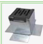
Eindkap - 100 x 100 mm - Verzinkt gesherardiseerd