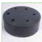
Eindkap - 160 mm - Afneembaar