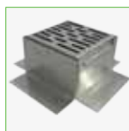
Eindkap - 170 x 170 mm - Roestvrijstaal