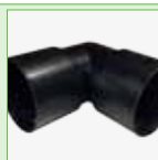
Bocht - 80 x 80 mm