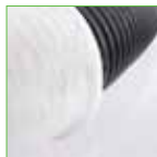
Bewatering/beluchtingsbuis - 80 mm - met kous