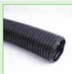
Bewatering/beluchtingsbuis - 80 mm