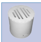
Eindkap - 80 mm - 100% biologisch afbreekbaar

Natudrain ® is een composteerbaar boombeluchttings-systeem/drainagebuis geproduceerd uit mais-zetmeel en het biokunststofgranulaat Cradonyl ®