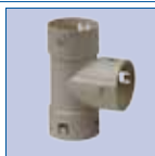
T-stuk - 80 x 80 x 80 mm - 100% biologisch afbreekbaar