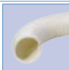
Bewatering/beluchttingsbuis - 80 mm - 100% biologisch afbreekbaar