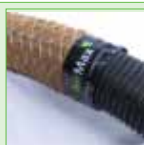
Bewatering/beluchtingsbuis - 80 mm - met kokos